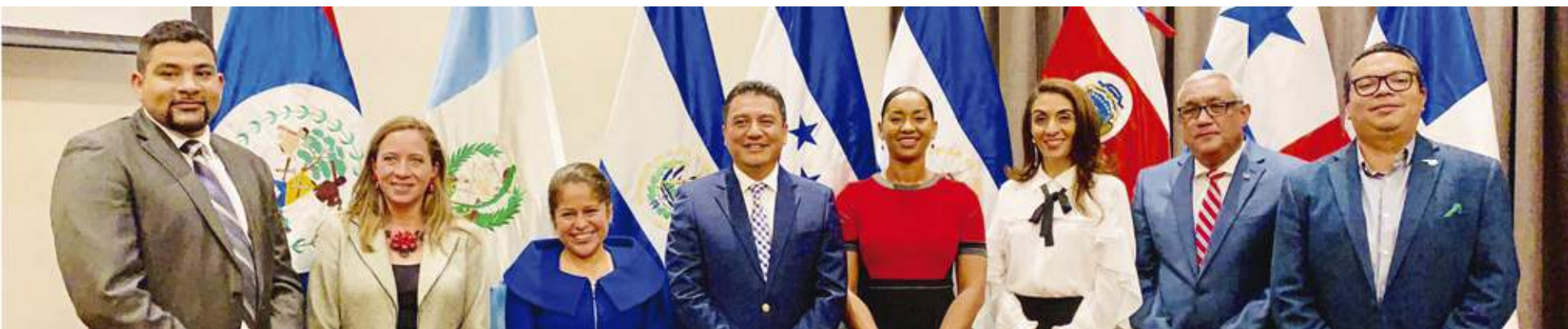
Ministros y delegados del Consejo Centroamericano de Turismo.

El Consejo Centroamericano de Turismo (CCT) se creó como Órgano de la Organización de los Estados Centroamericanos (ODECA) de acuerdo con la resolución VI de la Primera Conferencia Extraordinaria de Ministros de Relaciones Exteriores de Centroamérica, realizada en San Salvador; en la referida conferencia se creó la Secretaría de Integración Turística Centroamericana (SITCA) a regirse por su reglamento a ser elaborado por el CCT.