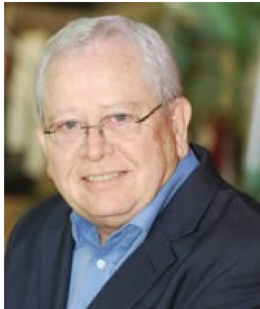
Arq. Mario Salinas Pasos Ministro de Turismo de Nicaragua Presidente Pro Tempore del CCT durante el segundo semestre de 2012